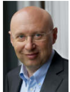
Foto: Stefan Hell; Quelle: Bernd Schuller, Max-Planck-Institut für biophysikalische Chemie, CC BY-SA 3.0 via Wikimedia Commons